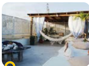
Posada Paraíso Azul