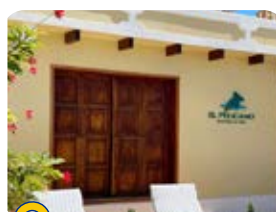
Posada El Pelicano

TRASLADOS A CAYOS CERCANOS (ALGUNAS POSADAS APLICAN)