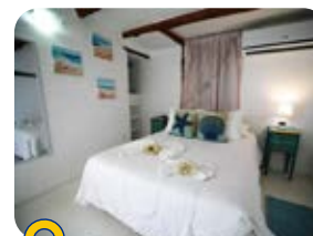
Posada Casa Turquesa