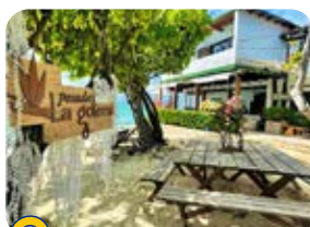
Posada La Gotera